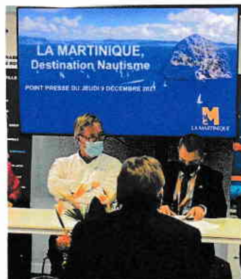
Conférence de Presse – 09 /12 /2021